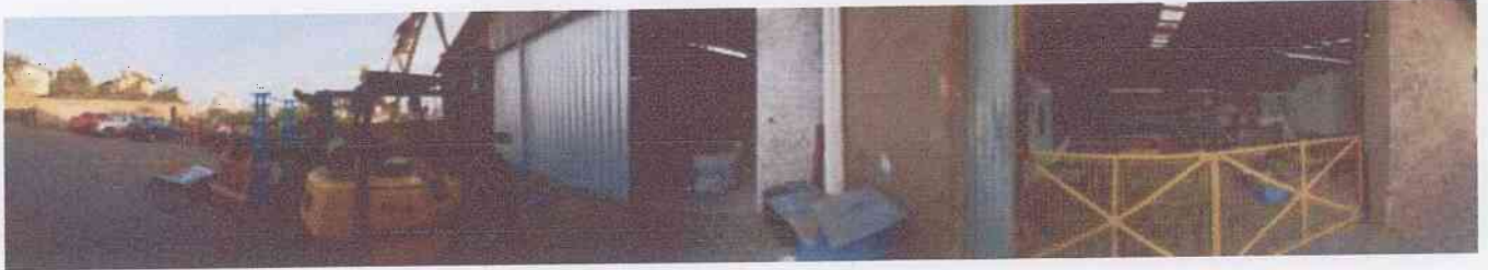
Imagem 360° do local:

SEG CONSULTORIA LTDA CNPJ: 12.062.754/0001-55 I.E 045/0104460 Rua Carlos Maggioni, 145 A Bairro: São Luís Farroupilha – RS CEP: 95.170-790 Fone: (54) 9 9923 5475 www.seg.ind.br